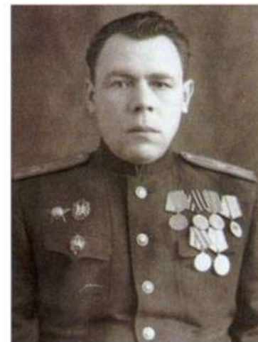
Тимошенков Константин Григорьевич, начальник Управления НКГБ (НКВД) Краснодарского края (апрель 1941 г. - апрель 1943 г.)