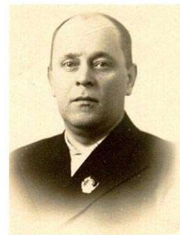
Селезнев Петр Иванович, первый секретарь Краснодарского крайкома ВКП(б) (февраль 1939 г. - март 1949 г.)