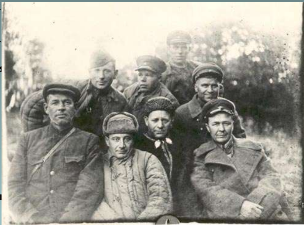
Партизаны Ладожского партизанского отряда с командирами 23-го полка погранвойск НКВД. Лагонаки, октябрь 1942 г.

Наибольшую известность среди этой категории операций, проведенных партизанами в сентябре 1942 года, получил налет партизан отряда им. Гастелло Апшеронского района на гарнизон в поселке Конобоз. Налет был совершен на рассвете 27 сентября, в воскресенье, после тщательной разведки, силами 64 партизан, в том числе группы из 18 автоматчиков. На месте боя осталось 50 (по другим данным 90) убитых гитлеровцев, много раненных. Партизаны захватили станковый пулемет, сожгли весь лесоматериал и скрылись.