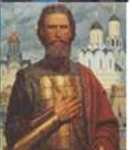
Донской Дмитрий Иванович