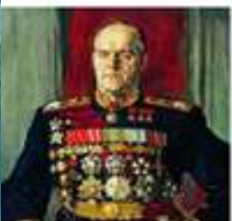
Жуков Георгий Константинович

В рамках недели истории было проведено голосование «Имя Победы». Итоги голосования учащихся МБОУ СОШ №6