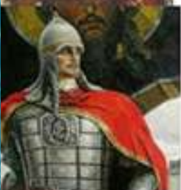
Невский Александр Ярославич