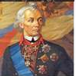
Суворов Александр Васильевич