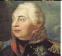
Кутузов Михаил Илларионович