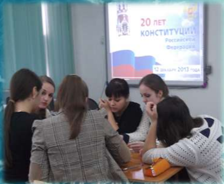
Конкурс «Ребусы и шарады»